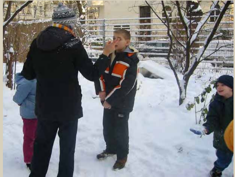
Die Schokolade wird abgearbeitet

Mit Hilfe der Sportlertabelle könnt Ihr ablesen, wie viel Minuten man Sport machen muss, um bestimmte Energien wieder loszuwerden.