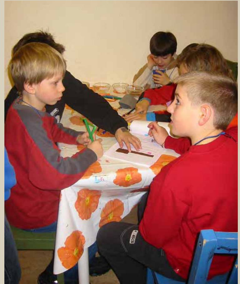
Die Kinder arbeiten an der Lösung ihrer Rallyeaufgaben

Eine Tafel Schokolade besteht aus 24 Schokostückchen. Eine ganze Tafel Schokolade hat insgesamt ungefähr 600 Kalorien. Das ist ziemlich viel Energie. Wie viele Kalorien hat ein Stückchen Schokolade?